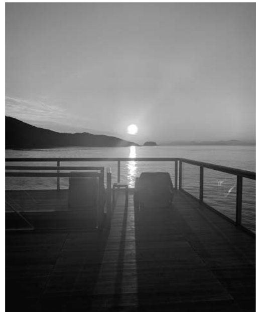
●まいど! 船上からおはようございます。 今日も素晴らしい日にしましょうね。(青木)