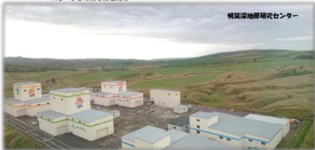
幌延深地層研究センター