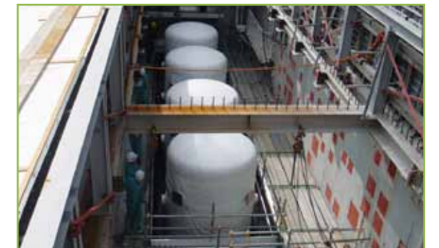
フィルタ・ベント

さらに、原子力発電所の外への放射性物質の拡散を抑えるため、移動式大容量ポンプ車や放水砲などによる放水手段が確保されています。