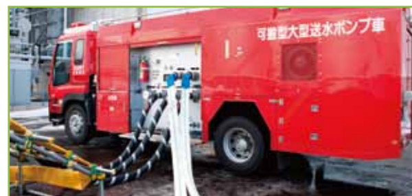
可搬型大型送水ポンプ車

原子力発電所内の火災に対しては、火災感知設備や消火設備の設置、難燃ケーブルの使用、耐火壁により防護された火災区域の設定など、火災の影響を軽減させる防護対策を実施しています。