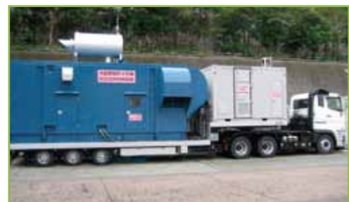
空冷式非常用発電装置