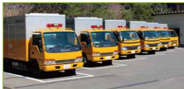
電源車 写真提供:東北電力(株)