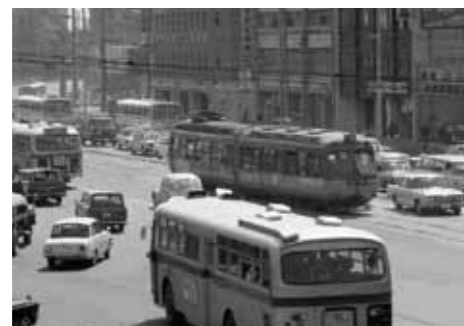
路面電車「玉川電気鉄道」

当時、中東やアフリカで相次いで大油田が発見され、政府はエネルギー供給の中心を国内産の石炭から海外産の石油に転換する政策を打ち出しました。この結果、日本のエネルギー自給率は、10年間で58%から15%へと大幅に低下しました。