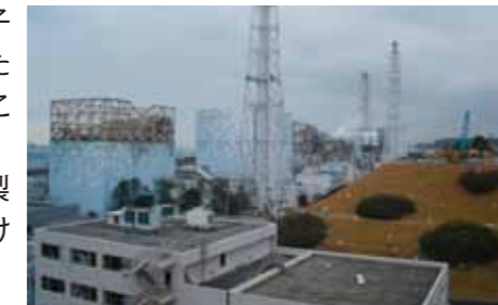
福島第一原子力発電所

また、地震や津波によって、被災地の石油供給拠点やガスの製造・供給設備が破損し、一部で機能停止に陥るなど、災害時におけるエネルギー供給の脆弱性も露呈しました。