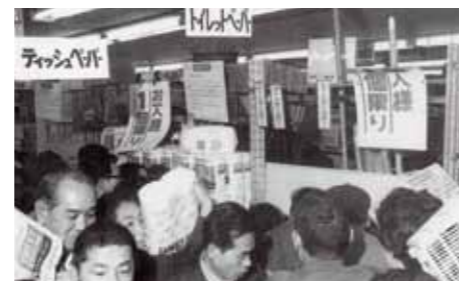
トイレ紙の買い占め騒動

日本では原油価格の高騰により電気料金も高騰し、政府は省エネの必要性や石油を中東に大きく頼るといった地政学的リスクを避け、原子力や天然ガスの普及拡大など、エネルギー源の多様化を進めました。