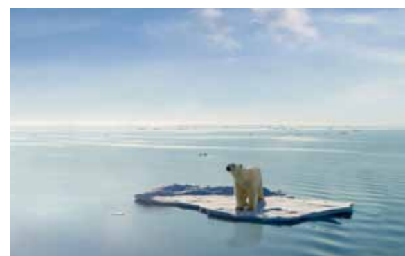
氷河や氷床の融解

支えてきました。一方で電気料金が世界的に見て高コストになっていることから、「安定供給の確保」、「料金の最大限抑制」、「電気利用者の選択肢を増やし、企業の事業機会を拡大する」という目的のもとで改革が進められました。