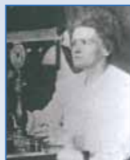
マリー・キュリー