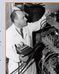
エンリコ・フェルミ