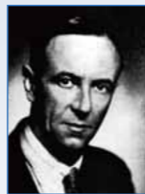
ジェームズ・チャドウィック

イギリスの物理学者ジェームズ・チャドウィックが、中性子を発見しました。これを受け、ドイツの物理学者ヴェルナー・ハイゼンベルクは、原子核が陽子と中性子で構成されていると考えました。