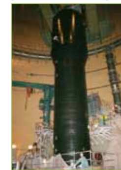
【蒸気発生器の取り替え】